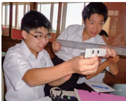
豊川市立南部中学校 (愛知県)