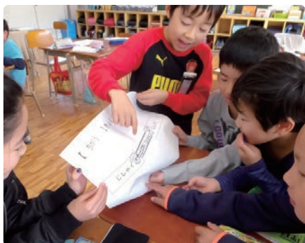
北九州市立藤松小学校 (福岡県)