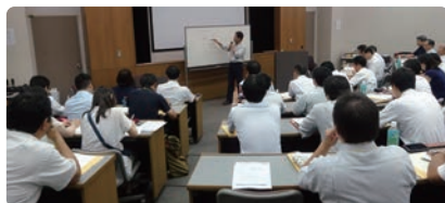
ソニー科学教育研究会 (SSTA)

「科学が好きな子どもを育てる」教育を推進する「ソニー科学教育研究会 (SSTA)」を支援しています。全国48支部、2000名超の小・中学校の教員が、理科・生活科の自主的な研究・研修活動をしています。