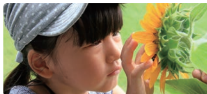
「科学する心」を見つけようフォトコンテスト

保護者が撮影した、0歳から6歳までの子どもの探求や感動の姿を捉えた写真を募集しています。子どもの成長を見つめ、家族の絆が育まれることを願っています。