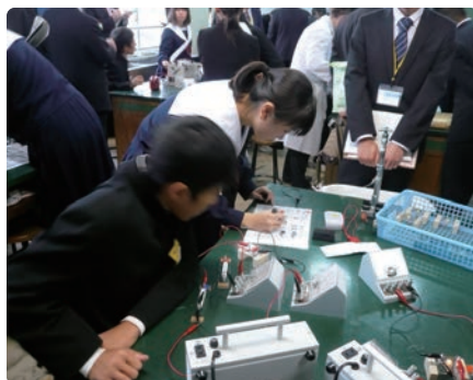
岐阜市立陽南中学校 (岐阜県)