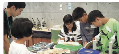
科学の泉-子ども夢教室

ノーベル化学賞受賞者の白川英樹先生を塾長に、小・中学生が「自然に学ぶ」をテーマに自ら探求する、5泊6日の自然科学教室を開催しています。