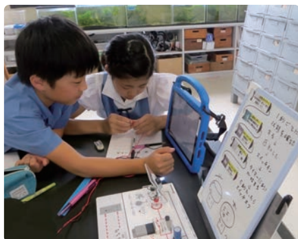
鹿児島大学教育学部附属小学校 (鹿児島県)