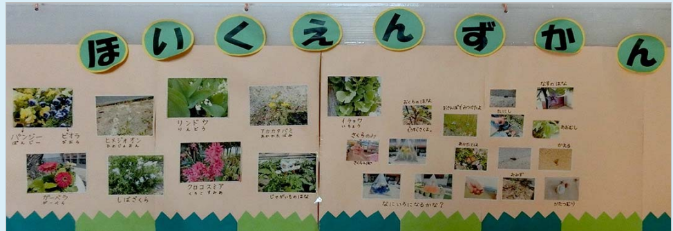
ほいくえんずかん（クリックで拡大）

子どもたちと一緒に園庭に咲いている草花や生き物の名前を調べ、保育園図鑑を作った。