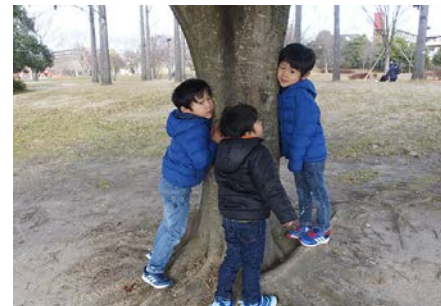
木の中って何か聞こえるの？ (3歳10か月、6歳1か月、6歳1か月) 公園だいすき3兄弟 (宮城県)

ラケット面の中心が支点だと落ちてしまうので、うまくバランスが取れるように頑張っていました。