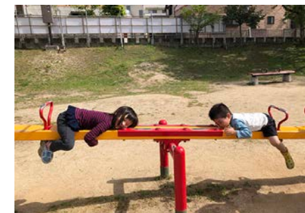
つりあうかな？ (5歳) マイメダカ (愛媛県)

水たまりに何度も自転車で突進する息子。スピードを出せば出すほど水が高く飛び上がって嬉しそうでした。