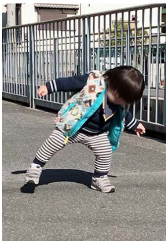
なんかくっついてる (1歳7か月)