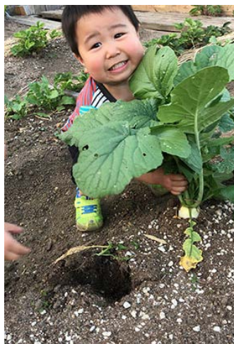
大根すげー (2歳6か月)

大根の皮むきに挑戦!! お手伝い大好きなので、色々な事をしてくれます。料理はまだまだ難しいね、