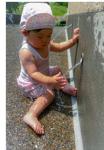
つかめないなあ (0歳11カ月)

鏡を使って「いないいないばあ！」をするのが大好きな娘。あれ？ここにも自分もお顔が映っているよ！