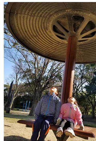
兄ちゃん、ここ、違う声するよ? (4歳4か月)

自分で植えた大根。葉っぱチクチク! 大根つよい。しゅげー(スゲー)! と収穫を楽しみました。