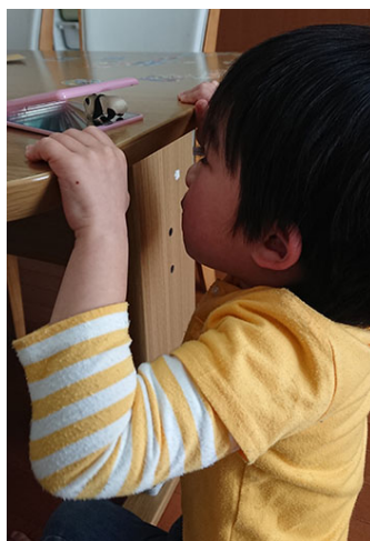
パンダくんいっぱい（5歳3カ月）