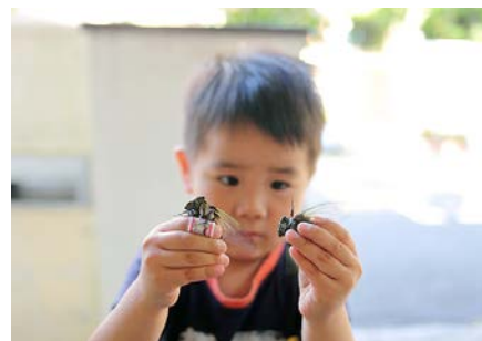
どこから鳴き声が出るの？ （3歳5カ月）

動物園に行った次の日、影で作った今にも動き出しそうな動物達に餌をあげていました。