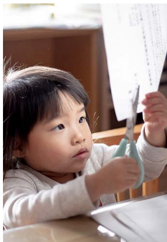
はさみって不思議 (3歳3カ月)

懐中電灯の光が不思議でならないらしく、オンオフを何回も繰り返していました。好奇心は科学の第一歩です。