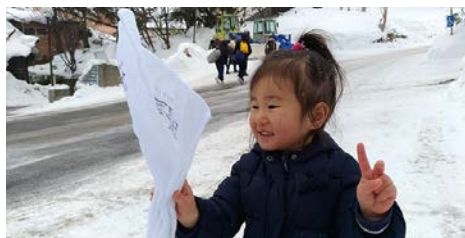
カッチコチ (2歳6か月)

滑り台との摩擦で髪が逆立ち! 上るとまたべったんこになるのが不思議で、何度も繰り返していました。