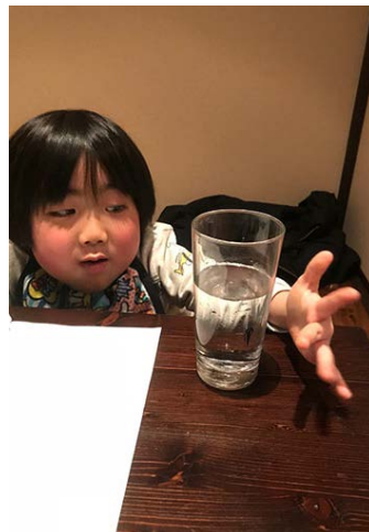
のびる、のび〜る (6歳6カ月)

落ちることが不思議なようで、転がった先をじっと眺めてはこちらを見て拾うよう催促。何度も繰り返す。