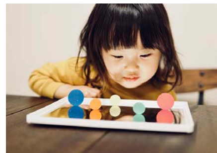
鏡の中の雪だるま (2歳4か月)

1歳半にして扇風機の「あ〜〜」となるやつを発見した娘。暫く「あ〜〜」がやみつきに。