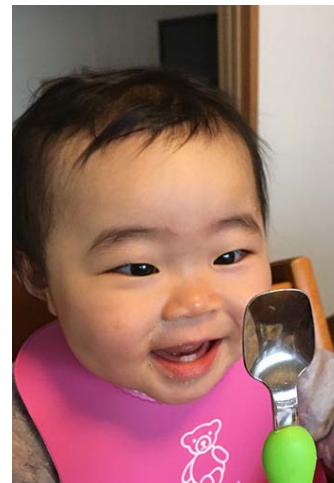
いないいないばあ！ (0歳11カ月)

グラスの向こう側に手をかざすと、指が大きくなりました。何度も指をかざしては「のびる、のび〜る！」