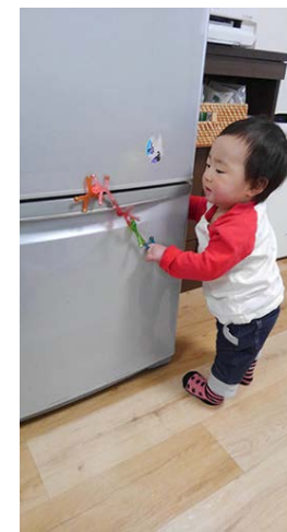
くっついたり、とれたり楽しい! (0歳9か月)

傘の下に入った瞬間に音の変化に気付いたようで上に向けて「あ〜」と叫びだした妹。兄も一緒に「あ〜」。