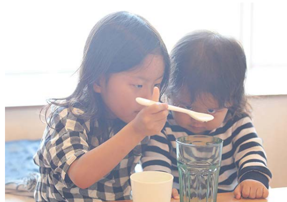
溢れ...ない！？ (2歳4ヵ月、5歳7ヵ月) AZUSA (海外)

植物から匂いがすることに気付いたようです。花らしきものは全て匂いを嗅いで回ります。