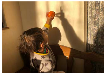
きつねさんどうぞ（3歳5カ月）

合わせ鏡に小さなパンダくんをのせ…「パンダ君がいっぱい!!」と大喜び。ミラーワールドに釘付けです。