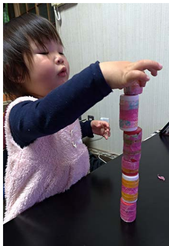
もうすぐ最高記録! (1歳7か月)

いつも絵本の中のでんてんに興味深々。春先のお散歩でほっこり(^^)させられました。