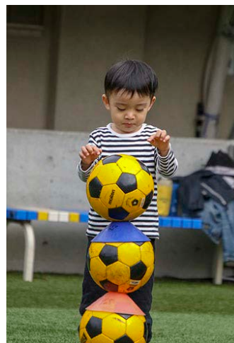
サッカースクールのはずが・・・ (3歳7カ月)