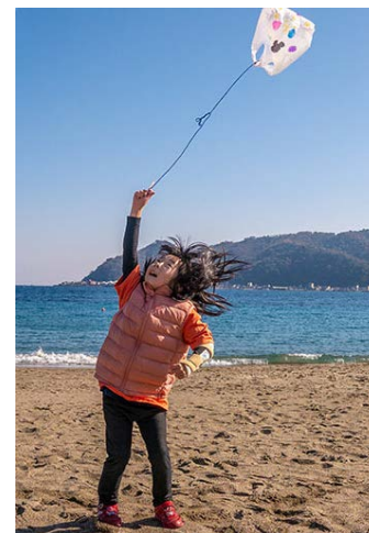
凧たこ上げ! (5歳7か月)

露天風呂の帰りに、凍ったタオルとsns映え…のはずが、タオルに夢中でカメラを見てくれませんでした。