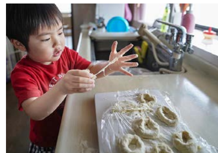
のびるのびる！ (2歳11カ月)

雨上がりのいつもの散歩道。水たまりに映った空の美しさに感動！ばしゃばしゃ、びちゃびちゃ、ハイポーズ！