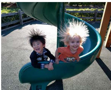
くじゃくみたい! (3歳)