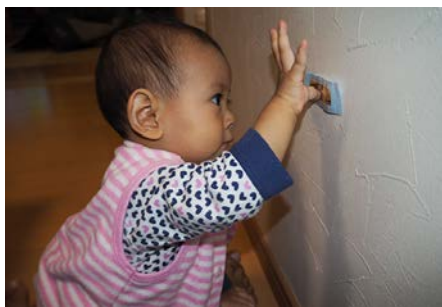
しってるもん (0歳9カ月)

流れる水を手で何回も握りしめては離して、「つかめないなあ」と難しい顔をしながら考えていました。