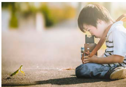
そこでストップ！（3歳）