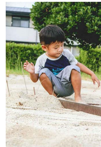
何本立つかな? (2歳10か月)

棒を振ると何重にも見える事に気が付き笑いが出る程楽しくなり、ゆっくり振ったり早く振ったりしていました。