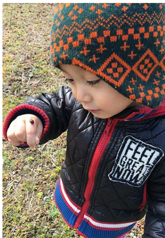
虫さん、はじめまして。 (1歳6か月)

鏡に置いたボールが雪だるまに見えてニヤリ。転がしたり角度を変えて見たり、鏡の不思議な世界に興味津々。