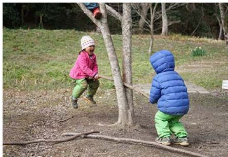
バランス取れた！ (3歳6か月、3歳11か月) かもにい (福岡県)

木の枝でシーソーを始めた二人。前に後ろに微妙に移動して、試行錯誤の末ついにバランスが取れてこの笑顔。