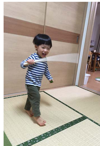
棒がいっぱいになった! (2歳1か月)

音を鳴らして遊ぶだけだったのが、積み上げられるように!これが乗ったら最高記録だ☆