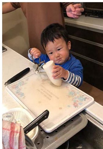
どーやるの?? (2歳0か月)

大きく足を開いて変わった歩き方をする息子。足についてくる黒いものが気になり、不思議そうに歩いていた。