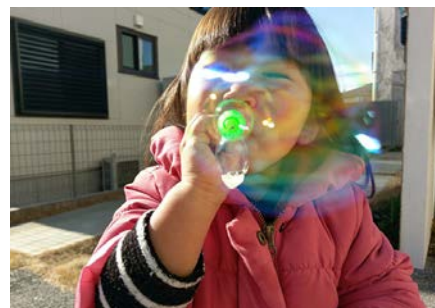
お母さん、虹色になあれ！ （3歳0カ月）

わー！すごい！と初めて見るカマキリに感動する息子。カメラを構えカマキリの姿をとらえようと真剣です。