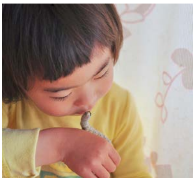
カイコってかわいい (3歳)