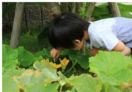
かぼちゃの受粉 (4歳) makaho (和歌山県)

公園のいちょうの周りに沢山の幼木。引き抜くと、種となった銀杏の実が。これは何だ？と、素直な疑問。