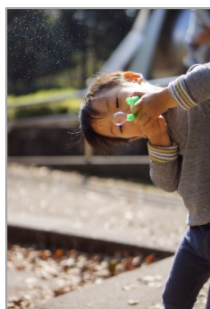
シャボン玉、こうやって吹くと?