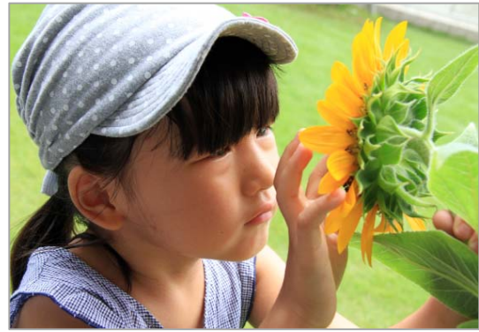
ヒマワリの観察(6歳:makahoさん) ヒマワリの丸い部分に種が出来るんだと言うと いくつ出来るんだろうと真剣に小さな模様を数え出しました。