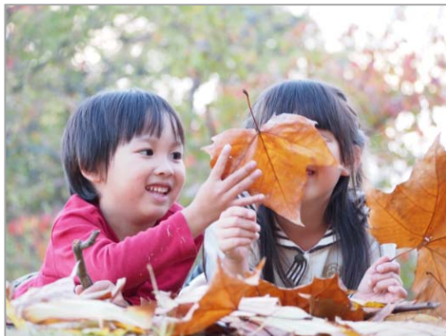
どんなにおい?(5歳6ヶ月:アルパカさん) いろんな落ち葉を拾って、どんなにおいがするか 比べていました。枯葉はくさいらしいです。