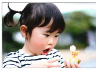
うまくできるかな?