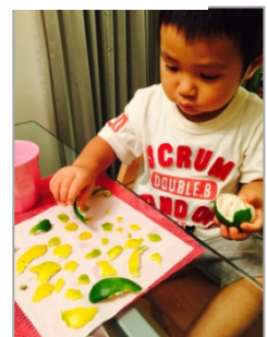
一度、ばらしてみよう

きらり賞(42作品)はこちらをご覧ください http://www.sony-ef.or.jp/sef/contest/gallery/index.html