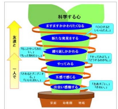
図1：「科学する心」の捉え（図をクリックで拡大）

本園では、遊びを通して生じる様々な姿から読み取れる「出会い感動する」「五感で感じる」「やってみる」「繰り返し関わる」「新たな発見をする」「ますます関わりたくなる」の6つの心を「科学する心」と捉えている。幼児の遊びは、自然やもの、事象との出会い、「わあすごい」「きれい」などと感動することで始まる「①出会い感動する」。気付いたことに興味をもつことで見る、触るなど五感で感じながら関わるようになる「②五感で感じる」。そこで次第に、自分で作ったり、調べたりするなどの「③やってみる」行動が見られるようになる。そして、そのことに喜びや楽しさを見出すと、「もっとやってみよう」「もっと知りたい」と興味や関心をもって繰り返し関わるようになり、遊びを継続させていく「④繰り返し関わる」。さらに、その遊びに興味をもった友達や似ているが少し異なる遊びをしている友達と関わることにより、新しいアイデアが付加され、そのものや事象について「⑤新たな発見をする」。その発見をもとに、「⑥ ますます関わりたくなる」。この深まった姿が、生きる喜びを味わった姿であり、生きる力を育むことに繋がると考える。（図1）