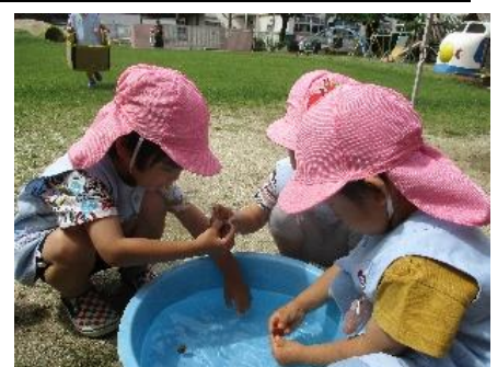
グルグルグル〜「黒くなあれ」