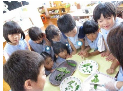
「大人の包丁でやればいいんだよ」