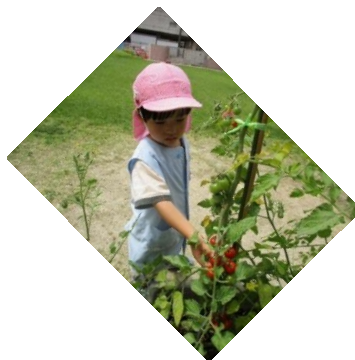
「ミニトマトできてるよ」