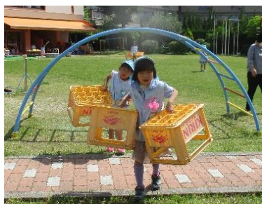
「いいこと思い付いた!」