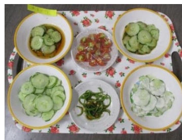
「しょうゆ味、マヨネーズ味、味付けなし」