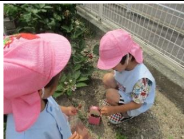
「たくさん採れたよ」