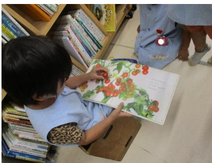
「これ、僕のトマトと一緒に」

また、ミニトマトの絵本が、偶然に近くにあったことや、ミニトマトを見つけたうれしさを教師が受け止めたことが、自分の思いを表現する姿につながった①③。