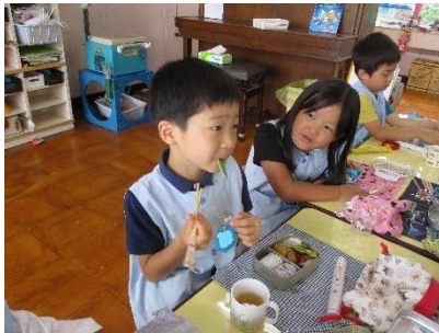
「大きいのは硬いな」

また、幼児や保護者、他の職員にも目につきやすい畑での栽培は、野菜の生長について皆で話題にしやすかった。そのなかで、大きいオクラは食べることはできないと聞いたものの、幼児にとって、大きく育ったのになぜ食べられないのかと思う幼児がいたため、幼稚園で実際に食べる機会を作った①。その出来事を保護者に知らせることで、家庭でも話題になり、刻む前の状態のオクラを見せたということを知った。そこで、実際に触ったり食べたりする経験を通して、適した大きさや食べごろがあることをより実感することができた。