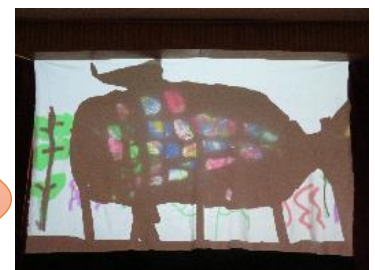
学びを生かして遊び を創り、披露する。

2月に生活楽しみ会を行っている。その話題をすると、光で遊んだ子どもたちから、「影絵をしたい。」という声が出てきた。そこで、白布を保育室にかけておくと、懐中電灯を使って手を映して遊び始めた。G児は光遊びで使っていたもの(セロファンを使って作ったペンギン)を持ち出して映した。それがよく映ったことで、他の子どもたちも動物を作り出した。作った物を布の後ろで動かしながら演じることが楽しく繰り返し遊んだ後、本の表紙の光に魅了されて、『にじいろのさかな』の劇をやってみることにになった。影絵で一人ずつ魚や海の生き物を作って映してみると、カラフルに彩られた幻想的な海の世界を表現することができた。