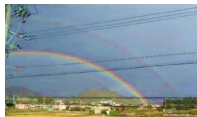
幼稚園に現れたダブルレインボー

翌日、外でシャワーから水を出すとなんと本当に見えた。しかも、ダブルレインボー!!得意気に話していたA児は、「僕が作ったんだよ!線路みたいに2本あるんだよ。」と自信をもって話した。周りには、「私だって知っているよ。」と次々に見せてくれた。前日に見たあの虹のように、「すごいじゃん!なかなか見ることができない虹を作ることができたんだよ!」と子どもたちの発見に教師も感動した。