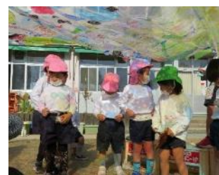
異年齢に広がる光の輪