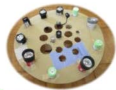
特製プラネタリウム投影機

それから、何本がいいか、実験してみるようになった。試行錯誤を繰り返すうちに、「これがちょうどいい!」、「何本?5本だ!」、「全体に映った。」と、実際に試してみることで、ちょうどよい明るさになり、模様が全体に映るようになった。年少児や年中児を誘いに行き、自分たちが考え抜いて見つけた『懐中電灯が5本で映したカラフルプラネタリウム』を見てもらうことができた。「きれい!」、「たいようさん(年長児)、すごいね。」と憧れの眼差しで喜んでもらったことが、子どもたちの喜びになった。